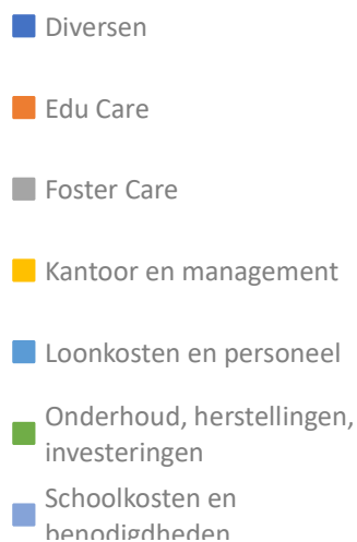
Verdeling van de kosten